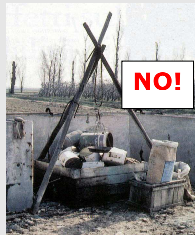
I contenitori vuoti dei prodotti fitosanitari sono considerati rifiuti pericolosi e non vanno abbandonati nell'ambiente