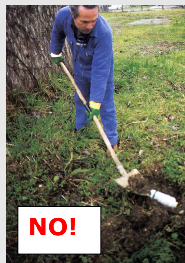
E' assolutamente vietato interrare i contenitori vuoti dei prodotti fitosanitari