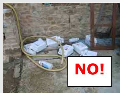
I contenitori vuoti rappresentano una fonte di inquinamento e di pericolo