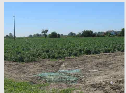
Inquinamento puntiforme del terreno per smaltimento della miscela residua.